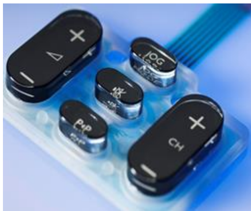
Tastenfeld mit Tiefenwirkung